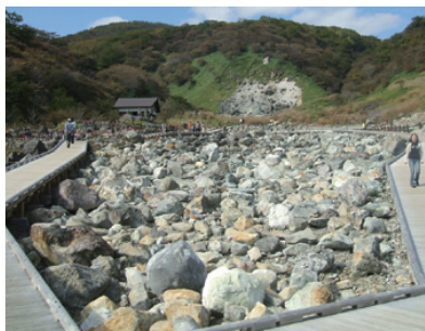
那須湯本の殺生石。辺りには硫黄の匂いが立ち込める