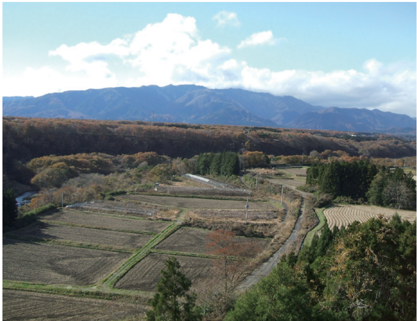
●●●橋はムラを一望にできる絶景ポイント、遠くに那須連山の雄大な姿も望める

四季折々の自然を楽しむのも魅力のひとつ。秋には見事な紅葉が楽しめます。那須連山の主峰である茶臼岳の山頂へロープウェイで登れば、那須一体の紅葉景色を望むことができます。秋ならではの感動的な風景をゆっくりと満喫してください。