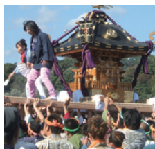
10月に行なわれる巻狩まつり